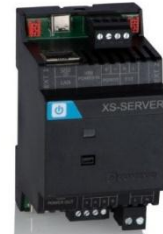
COMEXIO Smart-Meter 2.0 CME520